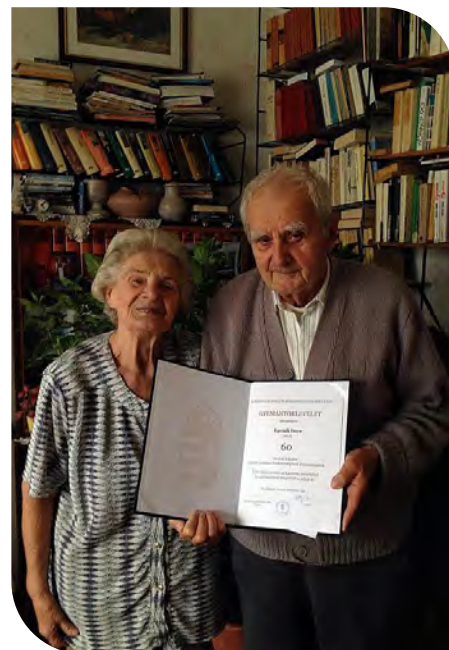
A gyémántdiploma és a gyémántlakodalmom éve 2014.

“Szerettük a mosolygós derűjét, nyugalmát, humorát, bölcsességét és nagy műveltségét. A Karádi tanár úr megszólítás dívott köreink-